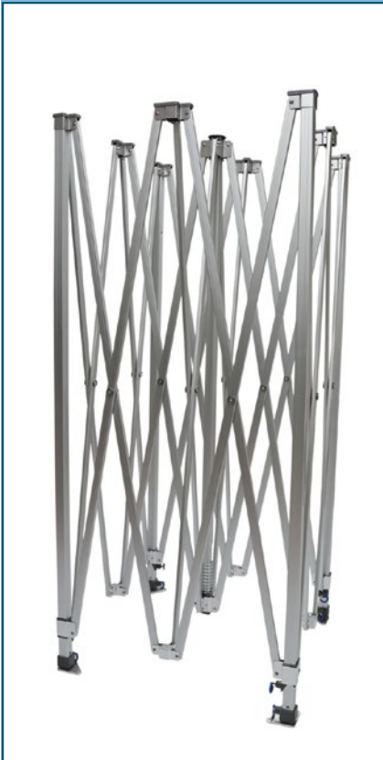
Struktur vollständig aus Aluminium.