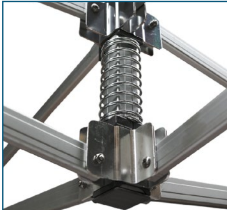
Stahlfeder, um das Dach perfekt gespannt zu halten.