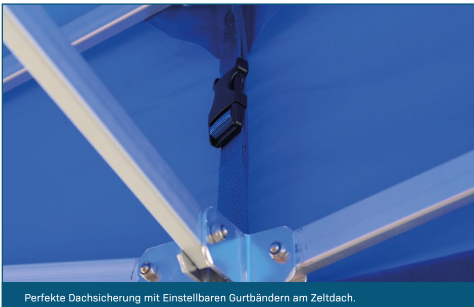
Perfekte Dachsicherung mit Einstellbaren Gurtbändern am Zeltdach.