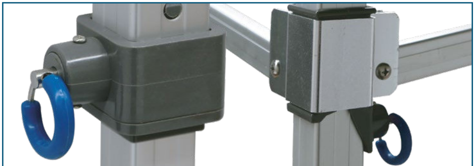
Verriegelungen alle außenliegend / Bedienung der Verriegelung nur durch leichtes ziehen am Verriegelungsring.