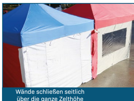
Wände schließen seitlich über die ganze Zelthöhe