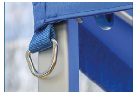
Gurtband mit Metallring zum sichern des Zeltes mit Erdhaken.