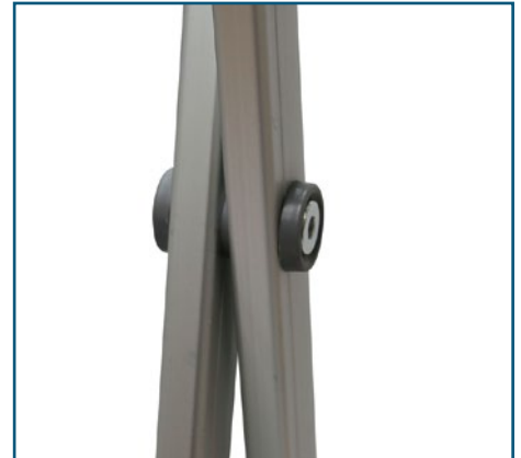
Scherenverbinder verstärkt und mit spezieller Verschraubung.