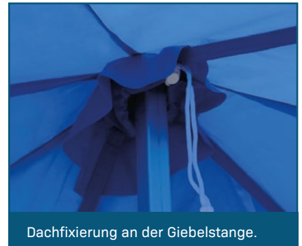
Dachfixierung an der Giebelstange.