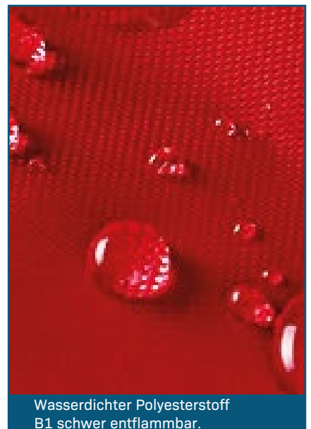
Wasserdichter Polyesterstoff B1 schwer entflammbar.