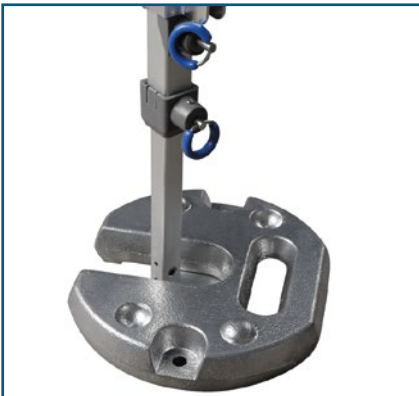
Beschwerungsplatte gegen Wind.