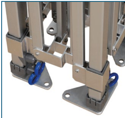
Stabile Zeltfüße für sicheren Stand.