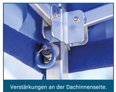
Verstärkungen an der Dachinnenseite.