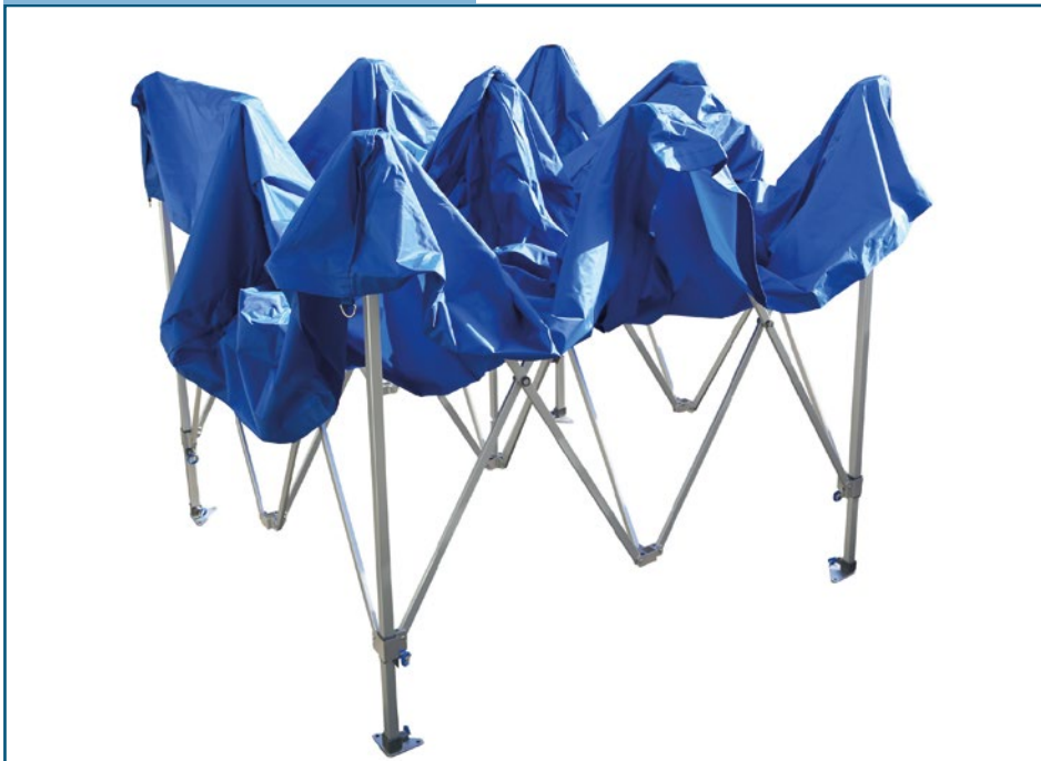
Struktur mit Dach in sekundenschnelle auch alleine aufzubauen.