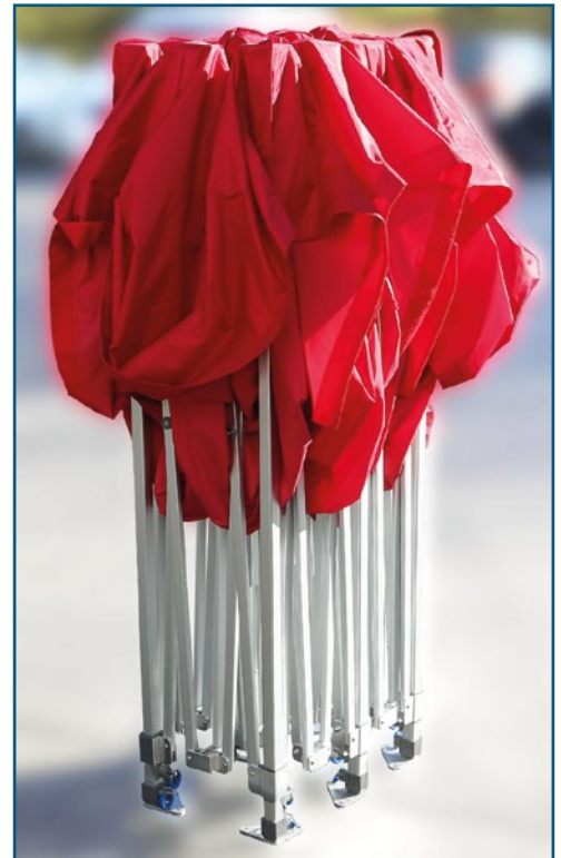
Das Dach bleibt immer montiert.